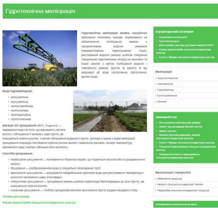
Рис. 2. Сторінка «Гідротехнічна меліорація»

Пункт меню «Програми технологічних розрахунків» пропонує користувачам ряд інтегрованих до системи програмних комплексів, розроблених в ІВПМ НААН. Вони реалізують декілька технологічних розрахунків для сільськогосподарського виробника. Наприклад, підсистема «Сівозміни» визначає оптимальний в даних агрокліматичних умовах господарства склад і чергування сільськогосподарських культур. Підсистема «Розрахунок водоподачі на зрошення найближчою насосною станцією» допомагає підібрати сільськогосподарські культури в умовах зрошення, щоб не перевищити можливості насосної станції, яка подає воду. Ці програми мають комерційний характер, обмежений доступ і працюють через відповідний логін і пароль. Планується розмістити також калькулятор доз добрив, який буде корисний для агрономів.