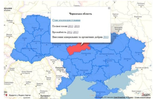
Рис. 3. Інтерактивна агроекологічна карта України

Для меліорованих земель інформаційна система реалізує запити користувача про норми водопотреби визначених сільськогосподарських культур з урахуванням кліматичних умов регіону. Для конкретного господарства надається інформація про дощувальну техніку і насосне обладнання для проведення поливів (рис. 2).