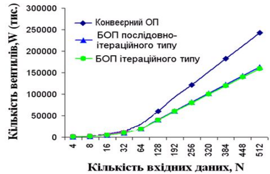
Рис. 3. Графік залежності загальної кількості вентилів від величини вхідних даних для різних типів БОП

Підставивши у формулу (1) значення кількості вентилів, з яких складаються БЕС, мультиплексори, демультимплексори та тригери, отримано числові значення, на основі яких побудовано графік залежності апаратних затрат від кількості вхідних даних для різних типів БОП (рис. 3).