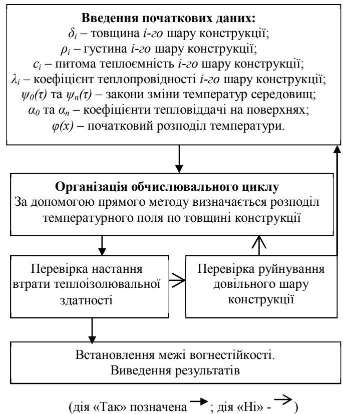
Рис. 1. Алгоритм обчислення втрати теплоізолювальної здатності з урахуванням руйнування довільного шару

4.1 Якщо конструкція не втратила своєї теплоізолювальної здатності, а вплив температури призвів до руйнування довільного шару конструкції, розрахунки припиняються, та фіксується час \tau_0 . Далі проводиться постановка нової задачі розрахунку розподілу нестационарного температурного поля багат шарової конструкції без урахування зруйнованого шару (групи шарів). Вводяться нові початкові дані. Знову проводять розрахунок і оператор перевіряє показники втрати теплоізолювальної здатності та руйнування довільного шару конструкції. Якщо ж вплив температури знову призвів до руйнування довільного шару (групи шарів) конструкції, то розрахунок припиняється та фіксується час \tau_1 . Така процедура продовжується до втрати теплоізолювальної здатності конструкції. Загальним часом втрати теплоізолювальної здатності є сума всіх фіксованих значень часу, тобто \tau = \tau_0 + \tau_1 + \dots + \tau_n , де \tau_n час втрати теплоізолювальної здатності.