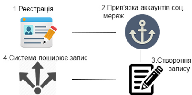
Рис. 1. Принципова схема роботи web-сервісу

Принципова схема роботи web-сервісу наведена на рис. 1.