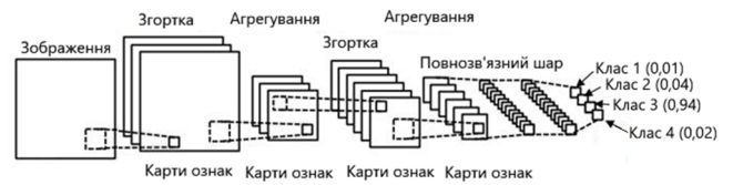
Рис. 1. Загальний вигляд згорткової нейронної мережі.

Комбіновану мережу, яка складається з згорткової нейронної мережі, класифікатора та розгорткової нейронної мережі наведено на рис. 2. Така архітектура дозволяє не тільки розпізнавати елементи зображення, а й помічати на ньому розпізнанні елементи. Розгорткова нейронна мережа є дзеркальним відображенням згорткової нейронної мережі.